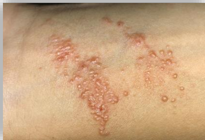
Figuur 2 Papules tgv Damp Hitte

De huid wordt voorzien van de juiste voeding als de volgende Zang in de juiste harmonie hun bijdragen leveren aan het vitaal houden van de huid. Deze organen zijn Xin (Hart), Fei (Lung), Pi (Spleen), Gan (Liver) en Shèn (Kidney).