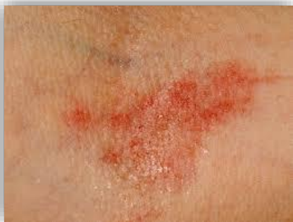
Figuur 3 Damp Hitte eczeem

(Xu Zhicai 493-572) Xie Huang San (Yellow- Draining Powder) kan hiervoor worden ingezet. Huo Xiang is in deze formule de Chén. Hua Xiang komt uit het hoofdstuk aromatisch damp verdrijvende kruiden. Shi Gao als Jun zorgt voor het Hitte klarende aspect van deze formule Hua Xiang werkt op de Pi -, Wei - en Fei mai . We zien bij deze pathologie een snelle pols en rode tong.