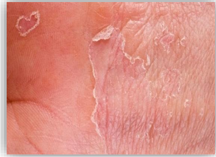
Figuur 4 Droog eczeem

Ook levert Da Zao een bijdrage in het Xue tonifiërende werking welke weer gerelateerd is aan Gan . De pols kan diep, leeg, gespannen zijn. De tong kan rood en gezwollen zijn met een grijs beslag.