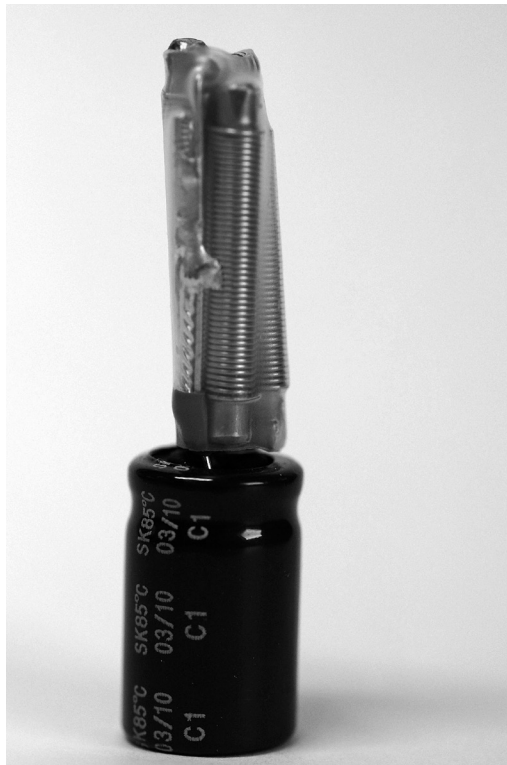
Figuur 1. Het elektronische circuit in Floww-producten.

tromagnetisch veld genereren dat de negatieve gevolgen van straling op biologische systemen tegengaat. De apparaten bevatten een elektronisch circuit waarvan de kern bestaat uit een inductiespoel en een condensator.